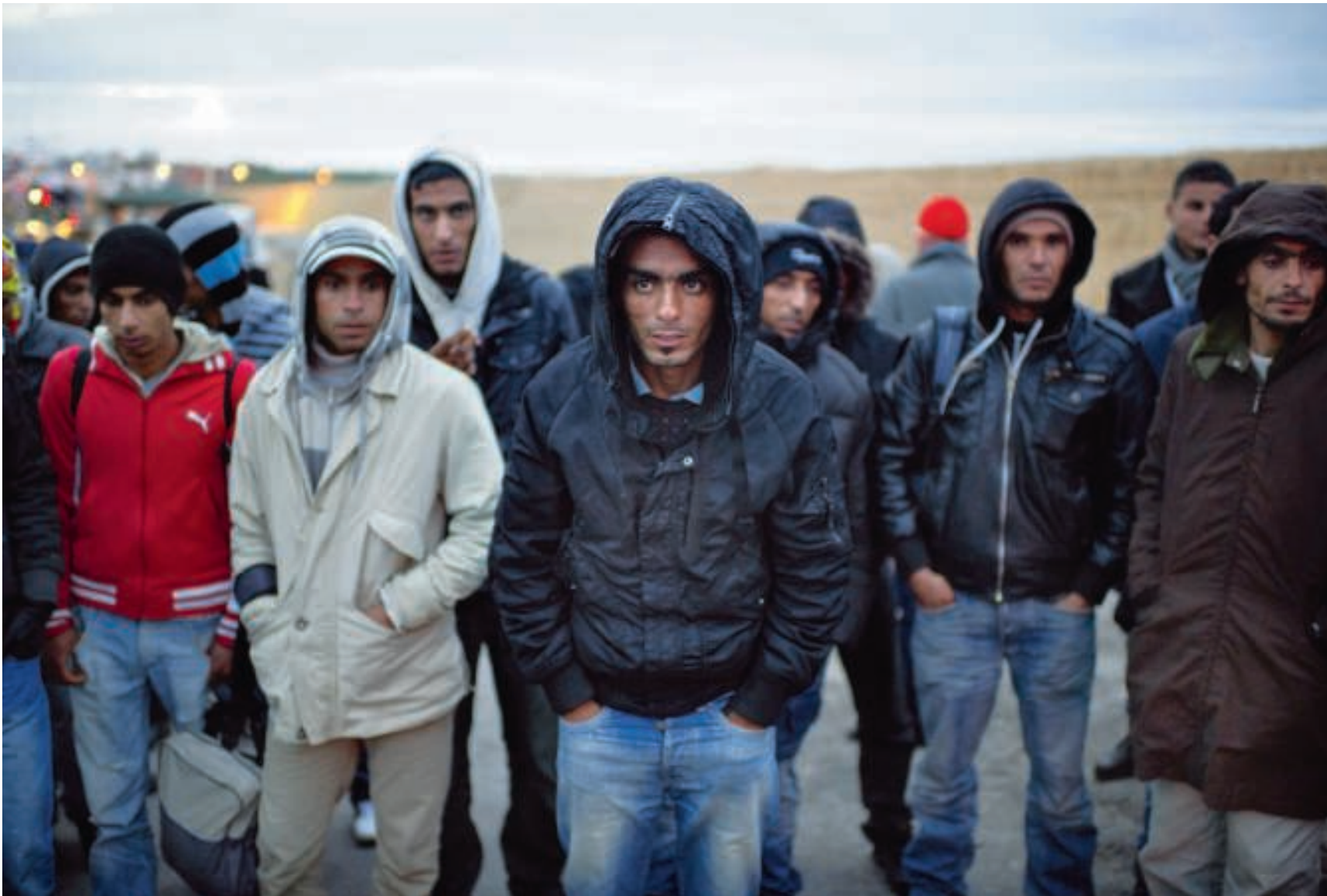
Immigranten wachten op het Italiaanse eiland Lampedusa op de bus die hen naar een tijdelijk opvangcentrum zal brengen.