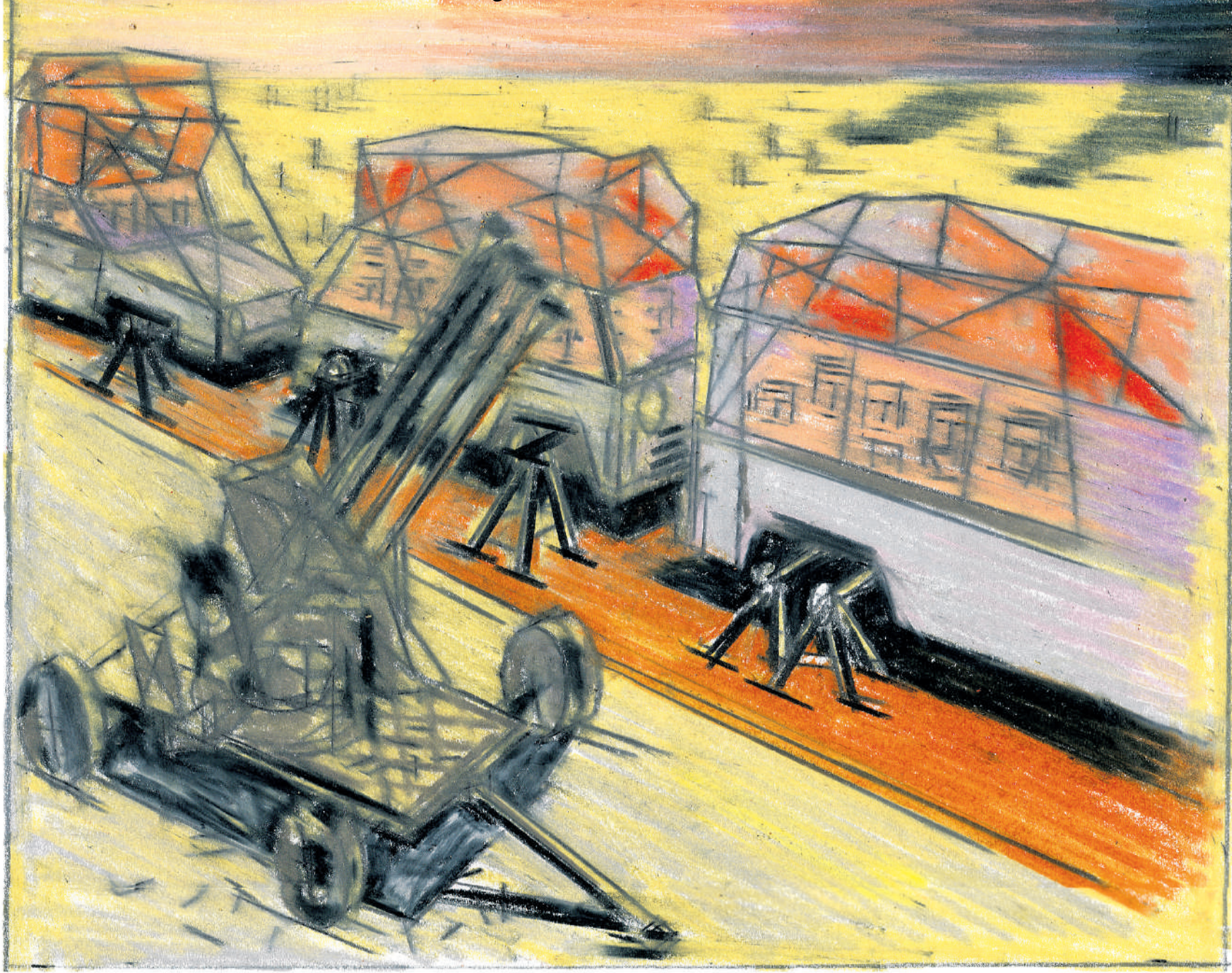
Illustratie Cyprian Koscielniak